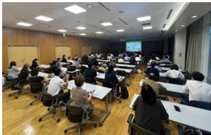
市民公開医療懇談会会場の様子